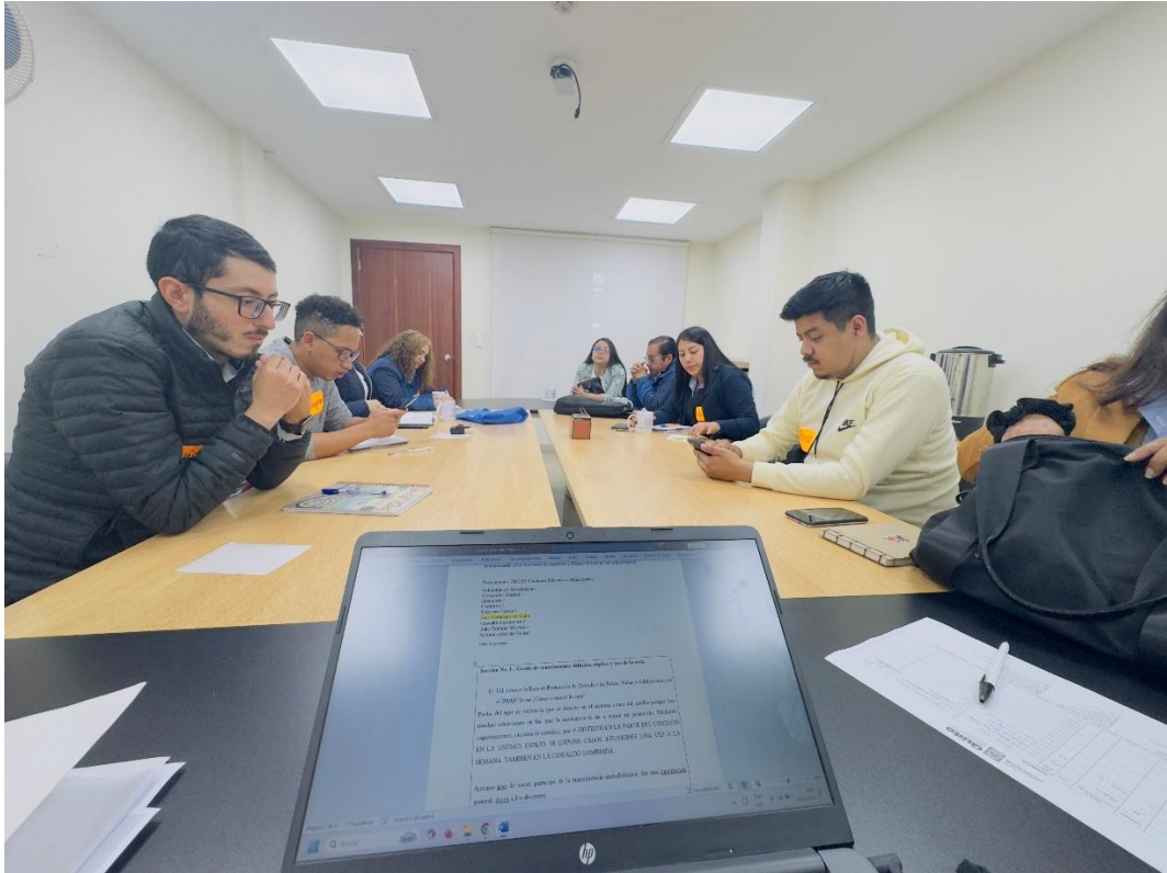
Grupo focal No. 2