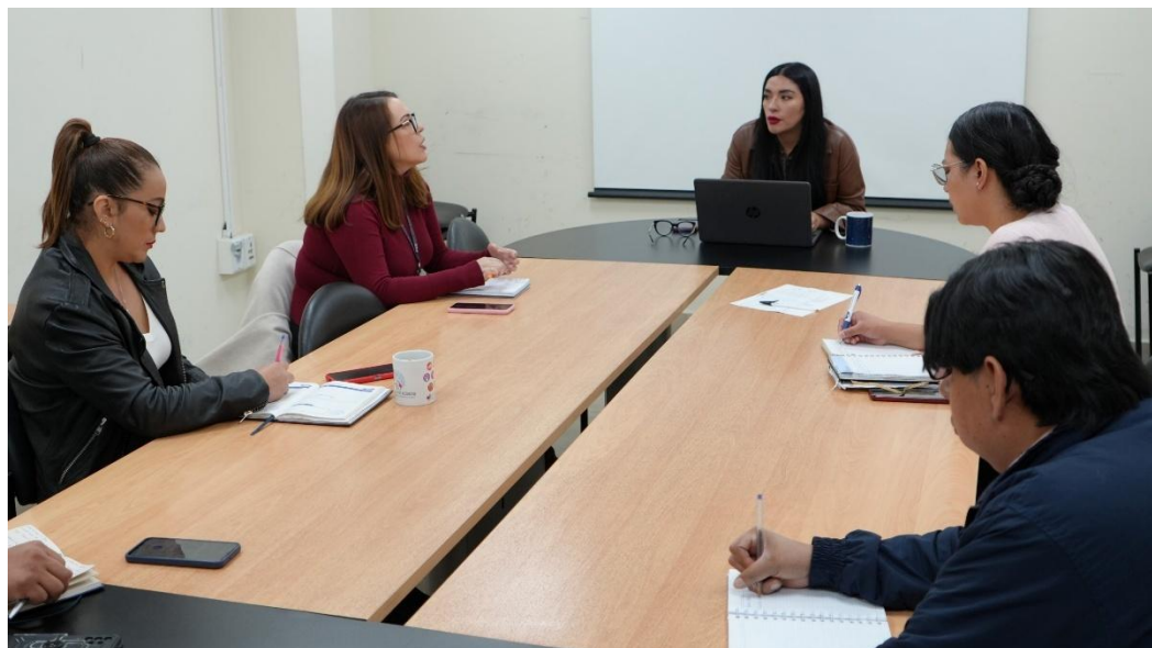
Grupo focal No. 3