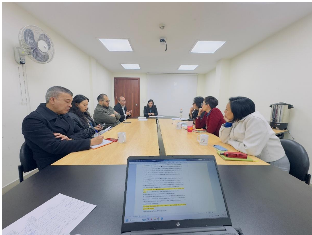
Grupo focal No. 4