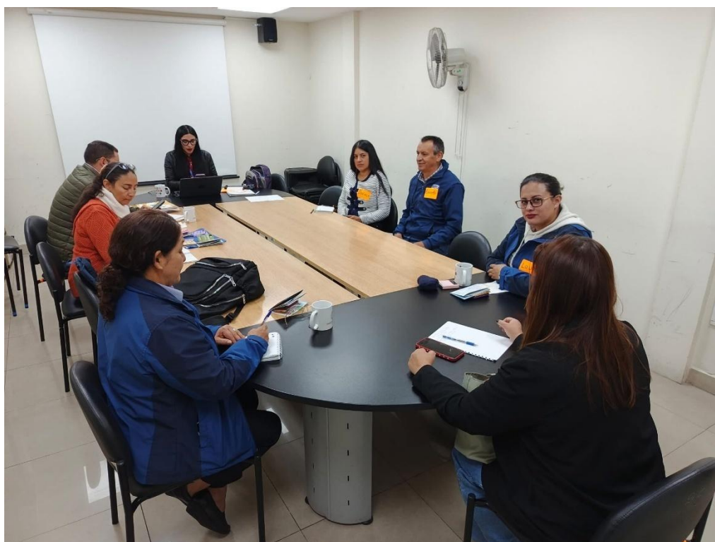
Grupo focal No. 1